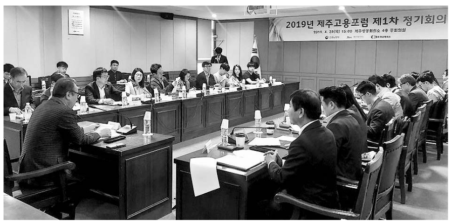
제주상공회의소는 25일 제주상공회의소 중회의실에서 '2019 제주고용포럼 1차 정기회의'를 개최했다.

한편 주간아파트가격동향에 대한 세부자료는 한국감정원 부동산통계정보시스템 R-ONE(www.r-one.co.kr) 또는 한국감정원 부동산정보 앱(스마트폰)을 통해 확인할 수 있다. 조상윤기자 tkchoi@halla.com