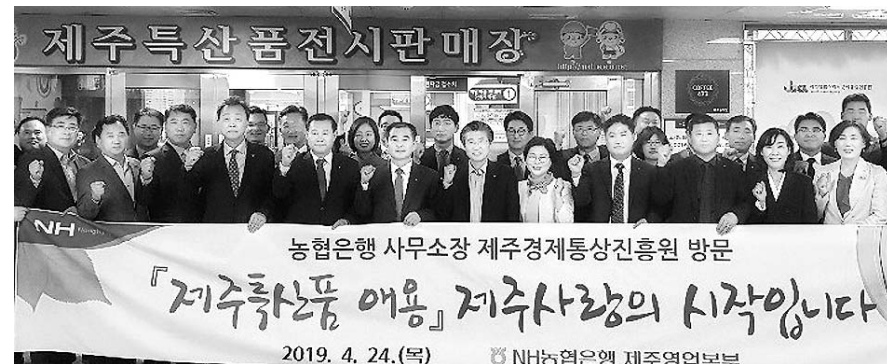
농협은행 사무소장 제주경제통상진흥원 방문. '제주특산품 애용' 제주사랑의 시작입니다. 2019. 4. 24.(목) NH농협은행 제주본부