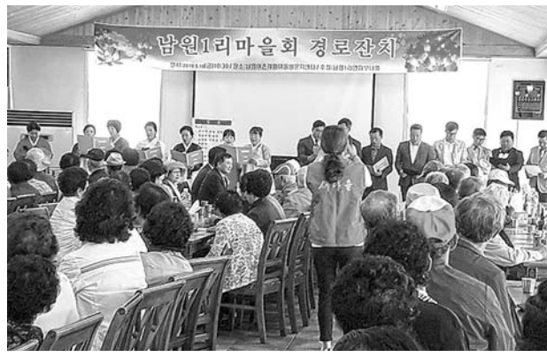
지난 10일 남원1리 마을 복지회관에서 열린 '남원1리 경로잔치'에서 마을원들과 부녀회원들이 함께 아버지 노래를 부르고 있다.

오인하 노인회장은 보답 인사를 통해 "우리 노인들은 4·3 등 지난 어려운 시절을 거쳐 오면서 오로지 내자식들을 성공적으로 키워내겠다는 일념으로