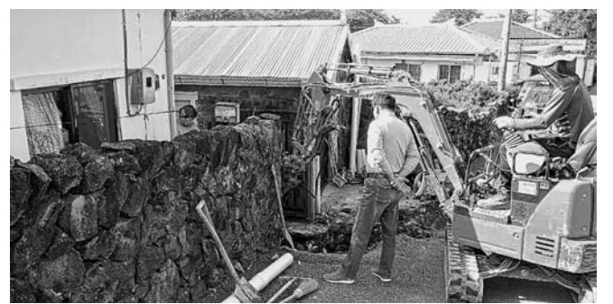
가구를 방문해 지붕수리, 전기판넬 설치 등을 무료로 실시했다.

(주)성우건설은 지난 2017년 1월부터 '착한가게'로 매월 기부를 이어오고 있으며, 지난해에는 홀몸어르신 3