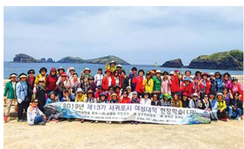
네스코 세계지질공원인 수월봉 트레일을 지역해설사의 설명을 들으며 진행했다.

서귀포시가 제주한라대학교 평생교육원에 위탁 운영하는 2019년 제13기 서귀포시 여성대학 상반기 현장학습이 14일 수강신청자 70여명이 참여한 가운데 열렸다. 이날 수강생들은 일제강점기 일본이 중·일전쟁의 전초기지로 삼았던 알뜨르비행장을 방문해 당시 비행장과 전투기 격납고 건설에 강제동원됐던 도민들이 겪었을 고초와 아픈 역사를 되돌아보는 시간을 가졌다. 또 환경면 고산리에 위치한 유