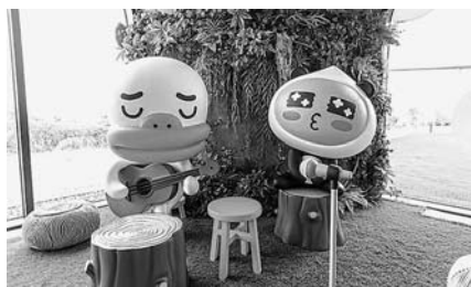
15일 카카오 제주 본사 1층에 문을 연 '카카오프렌즈 스토어'의 모습.

카카오 제주 본사 1층에 복합문화공간 '카카오프렌즈 스토어@제주'가 문을 열었다. 카카오(공동대표 여민수, 조수웅)는 15일 제주도 본사 스페이스닷원 1층에 265m 2 규모의 '카카오프렌즈