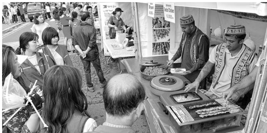
"다문화 음식 맛보세요" 19일 제주시청 앞 일대에서 제12주년 세계인의 날을 기념해 열린 '제주다문화축제'에서 다문화가족들이 자국의 전통 음식을 선보이고 있다.