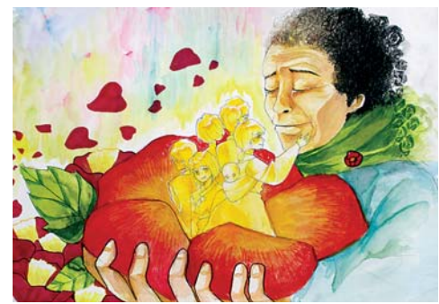
품집 제작 등이 진행될 예정이며, 입상자 명단과 심사평은 제주4·3평화재단 홈페이지 공지사항에서 확인할 수 있다.