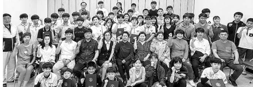
제주시체육회는 최근 시체육회에서 '2019 제주시체육회 우수선수 및 지도자 선정증서 전달식'을 개최했다. 대상자는 48명이다.

이 때문에 태극전사들의 승리욕도 커질 수밖에 없다. 일본은 조별리그 B조에서 1승2무(승점 5)의 무패행진을 펼치며 이탈리아(승점 7)에 이어 조 2위로 16강에 올랐다. 일본과 16강 대전을 받은 정정용 감독은 “일본이라고 해서 특별한 것은 아니다. 16강에 오른 한 팀일 뿐이다”라며 “우리 선수들이 자신감을 가지고 컨디션 조절만 잘하면 충분히 좋은 결과를 만들어낼 수 있다고 확신한다”고 말했다. 한국이 16강에서 일본을 물리치면 세네갈-나이지리아 승자와 8강에서 맞붙는다.