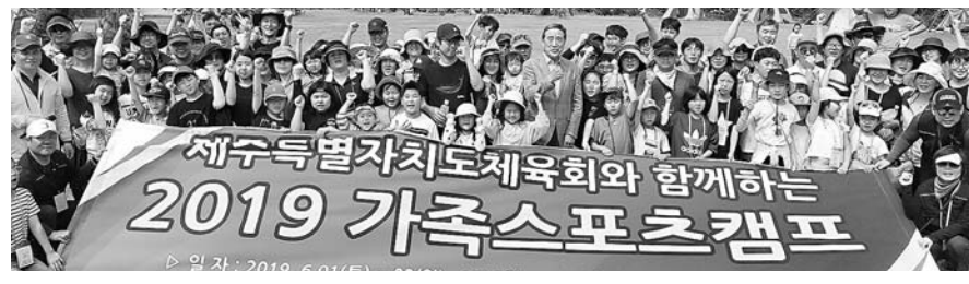
제주도체육회가 지난 1-2일 1박 2일간 제주도 교래생태체험장에서 마련한 2019가족스포츠캠프가 성황리에 막을 내렸다.