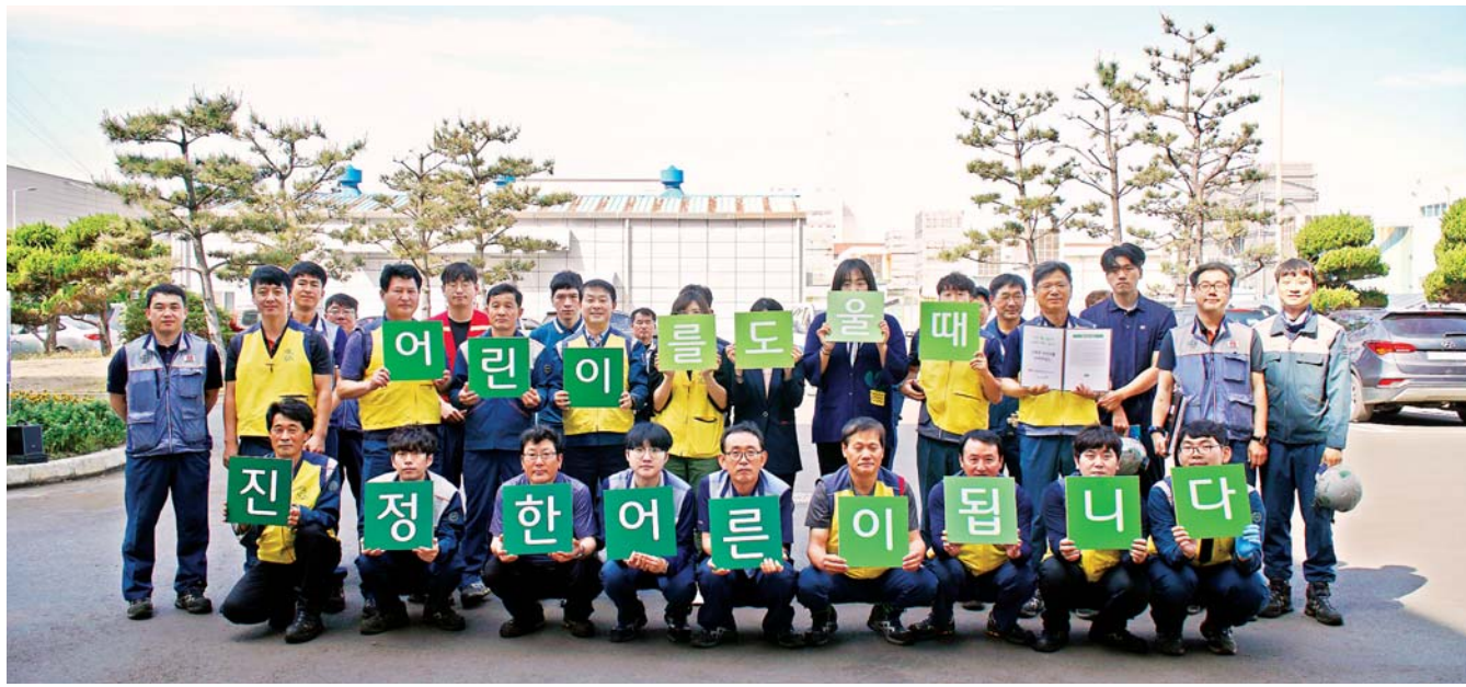
제주지역 소외된 어린이들을 위해 봉사·나눔활동에 앞장서고 있는 한전KPS(주) 제주사업소 임직원들.

한전KPS(주) 제주사업소 급여 기부 '엔젤펀드' 운영 가족들도 나눔·봉사 활동