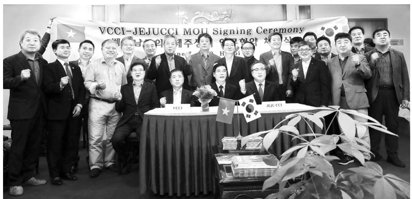
"경제 교류 잇자"... 손잡은 제주상의-베트남상공회의소 제주상공회의소는 지난 7일 베트남 하노이에서 베트남 상공회의소와 경제·무역 및 투자협력 강화를 위한 MOU를 체결했다. 이날 협약을 통해 앞으로 상호 경제 교류단 파견을 비롯 교역회와 전시회 참가협력, 경제·무역·관광·투자 정보 교류 등 다양한 분야에서 교류를 추진하기로 했다.

최근 식품업계와 주류업계에 새로운 윈윈 마케팅 전략으로 '푸드페어링'이 각광을 받고 있다. 푸드페어링은 음식과 술 궁합의 영어식 표현으로, 와인업계에서 주로 사용되던 것이 소주와 맥주시장까지 확대되고 있다. 9일 (주)한라산소주와 식품업계 등에 따르면 이달부터 '한라산 17' 신제품을 출시한 제주의 대표브랜드인 한라산소주와 농심의 미역듬뿍 초장비빔면의 푸드페어링이 각종 SNS를 통해 큰 인기를 누리고 있는 것으로 전해졌다. 한라산소주 관계자는 "양분화된 주류시장 중 저도주 시장의 공략을 위해 한라산 17을 출시하고 물류, 유통구조 개선을 통해 전국으로 공급을 확대하고 있는 시점에서 농심에서 제안해온 푸드페어링은 소비자의 관심과 접근성을 높여 긍정적인 홍보효과를 얻을 수 있을 것이라고 판단했다."