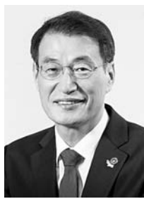
문 대 힘 제주국제자유도시개발센터(JDC) 이사장