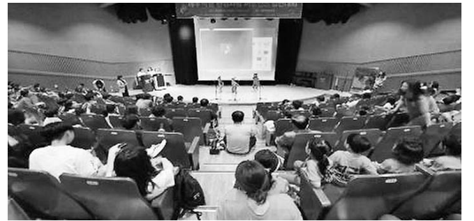
주시교육지원청이 후원했으며 올해 처음 열렸다. 심사 결과 초등부는 ‘제주랑 지구 뱀바 7팀’ (삼화초)이 대상(제주도교육감상)을 받았고, 중고등부는 ‘아폴로 팀’ (제주여상)이 대상(제주도지사상)의 영예를 안았다.

세계 환경의 날(6월 5일)을 기념해 지난 15일 제주학생문화원에서 열린 ‘제주 학생 환경사랑 퍼포먼스 경연대회’가 성황리에 마무리됐다. 이번 경연대회는 학생들의 생각으로 표현하는 환경사랑을 알아보기 위해 마련된 자리로 예선을 통과한 도내 12팀(초등 7팀, 중고등 5팀)이 참가해 환경보호라는 주제를 노래·춤·연극 등 다양한 형식으로 표현했다. 이 대회는 제주시지속가능발전협의회(회장 홍순병)가 주최하고 제주특별자치도와 제주시, 제주특별자치도교육청, 제