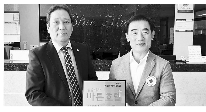
(주)블루하와이호텔(대표이사 문후근)은 지난 17일 호텔 로비에서 대한적십자사제주특별자치도지사가 실시하는 ‘씀씀이가 바른 캠페인’에 제60호 바른호텔로 동참했다.