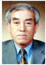
정 신 중 시민기자

한편 수망리산 178번지 일대에는 풍력4발전단지를 조성하고 에너지 고갈에 따른 신에너지 자원 개발을 위한 수망풍력 발전사업 EPC공사를 시행하고 있다.