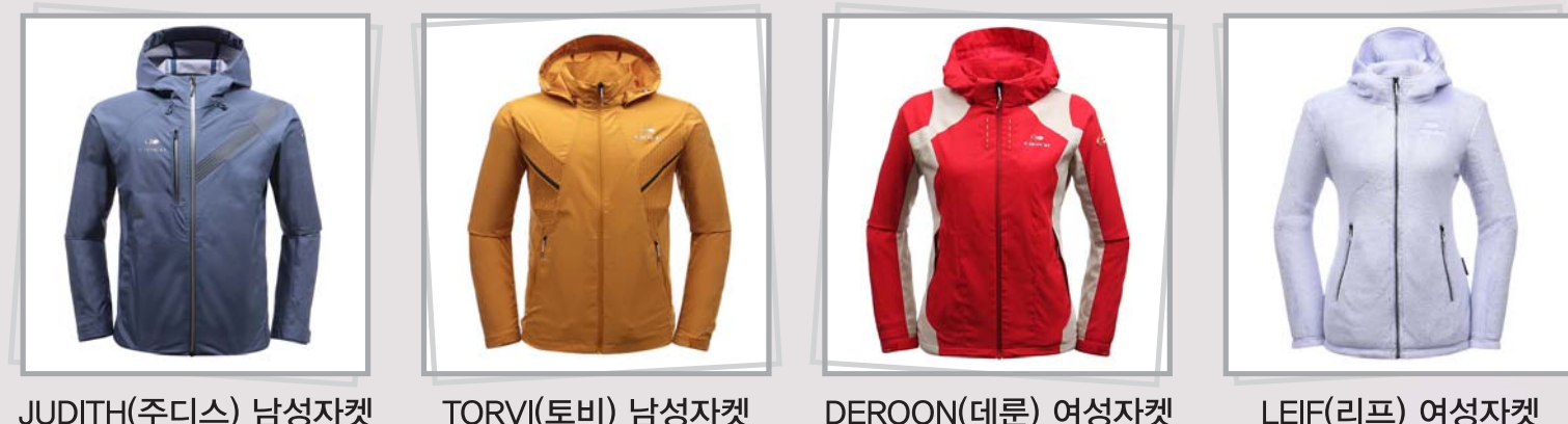
JUDITH(주디스) 남성자켓 TORVI(토비) 남성자켓 DEROON(데룬) 여성자켓 LEIF(리프) 여성자켓

· 기획·이월제품 40~60% · 단체복 주문시 각종 할인 우대 · 상품권 판매