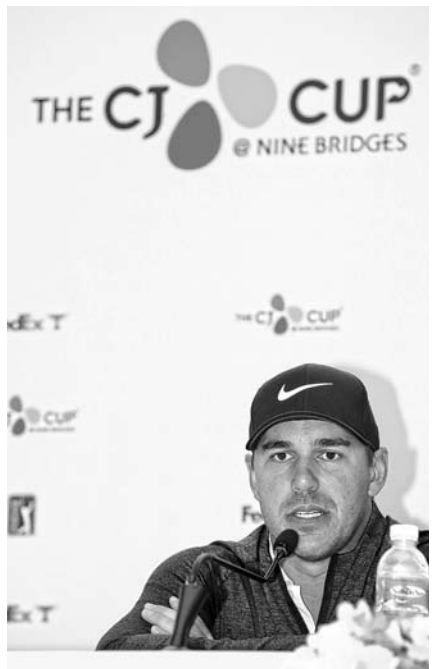
16일 제주 서귀포시 클럽 나인브릿지에서 열린 '더 CJ컵 @ 나인브릿지' 공식 기자회견에서 디펜딩 챔피언 브룩스 켈카(미국)가 참가 소감을 말하고 있다.

2017년에만 5승을 거둔 그는 "좋은 추억이 많은 곳에 다시 와서 기쁘다"며 "더 CJ컵은 좋은 코스와 많은 갤러리, 훌륭한 음식 등 환상적인 대회"라고 덕담했다. 2018년 8월 월드골프챔피언십(WGC) 브리지스톤 인비테이셔널 이후 우승 소식이 없다가 1년 만인 올해 8월 BMW 챔피언십에서 다시 정상에 오른 그는 "시즌