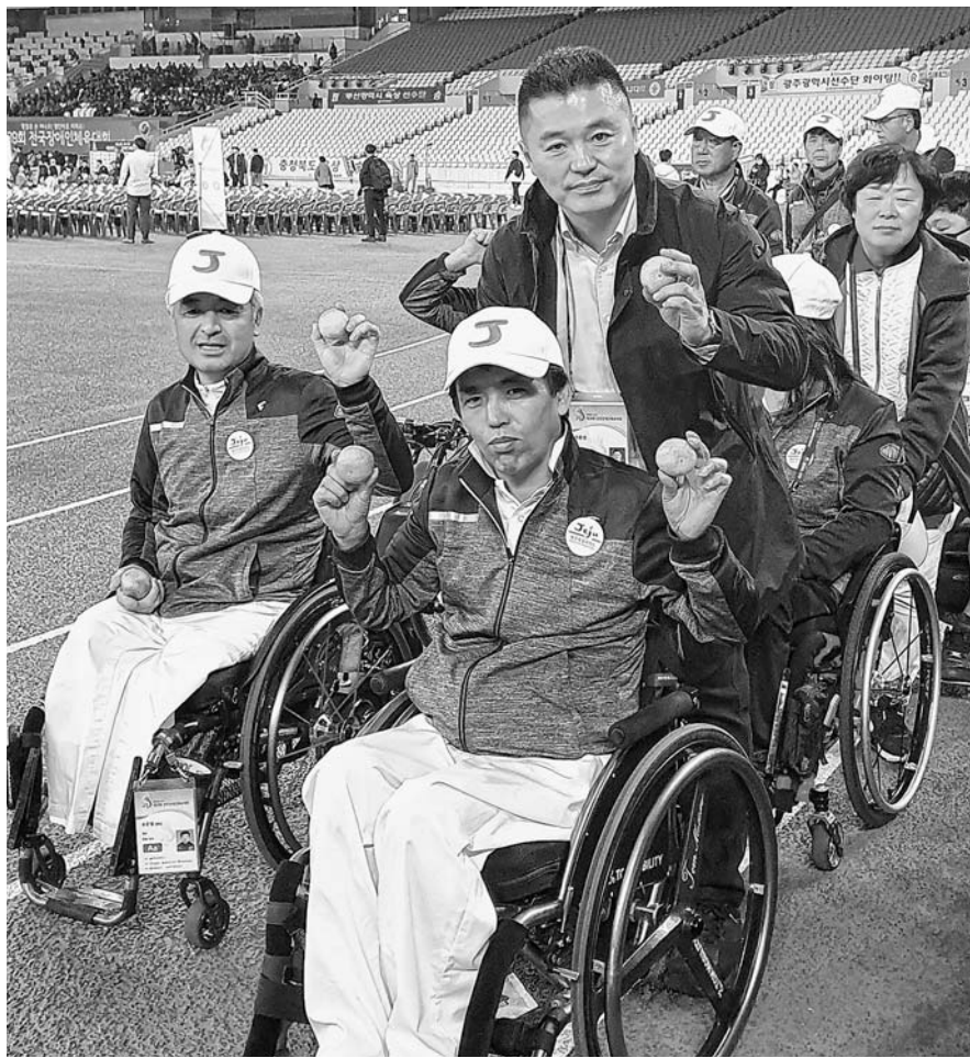
제주선수단이 지난 15일 서울 잠실종합운동장에서 열린 장애인체전 개막식에 임창하고 있다.

제주도장애인체육회 관계자는 "오늘 경기를 통해 목표 메달에 한층 더 가까워졌다"며 "목표치 메달을 달성하는 것도 중요하지만 선수들이 기량