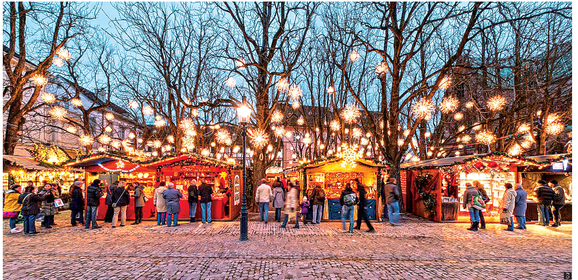
1 이보 사우터 SDX최고고객 담당이사 2 내년 하반기 개장 예정인 SIX디지털자산거래소. 3 크리스마스 음악, 반짝이는 불빛, 매력적인 아로마, 소중한 사람들과 다가오는 크리스마스의 마법을 즐기는 것만큼 특별한 것은 없다. 스위스 베른의 밤풍경. 고대기자 사진=주한 스위스 대사관 제공