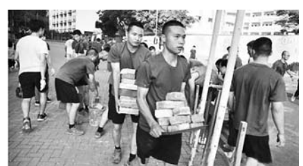
도로 장애물을 치우는 홍콩 주둔 인민해방군.

시진핑 중국 국가주석이 홍콩의 폭력을 중단시키고 혼란을 제압해야 한다는 '최후통첩' 이틀 만에 홍콩 주둔 인민해방군이 홍콩 거리로 나섰다.