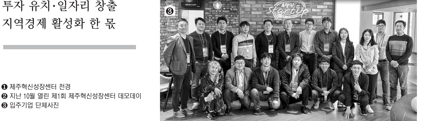
① 제주혁신성장센터 전경 ② 지난 10월 열린 제1회 제주혁신성장센터 데모데이 ③ 입주기업 단체사진