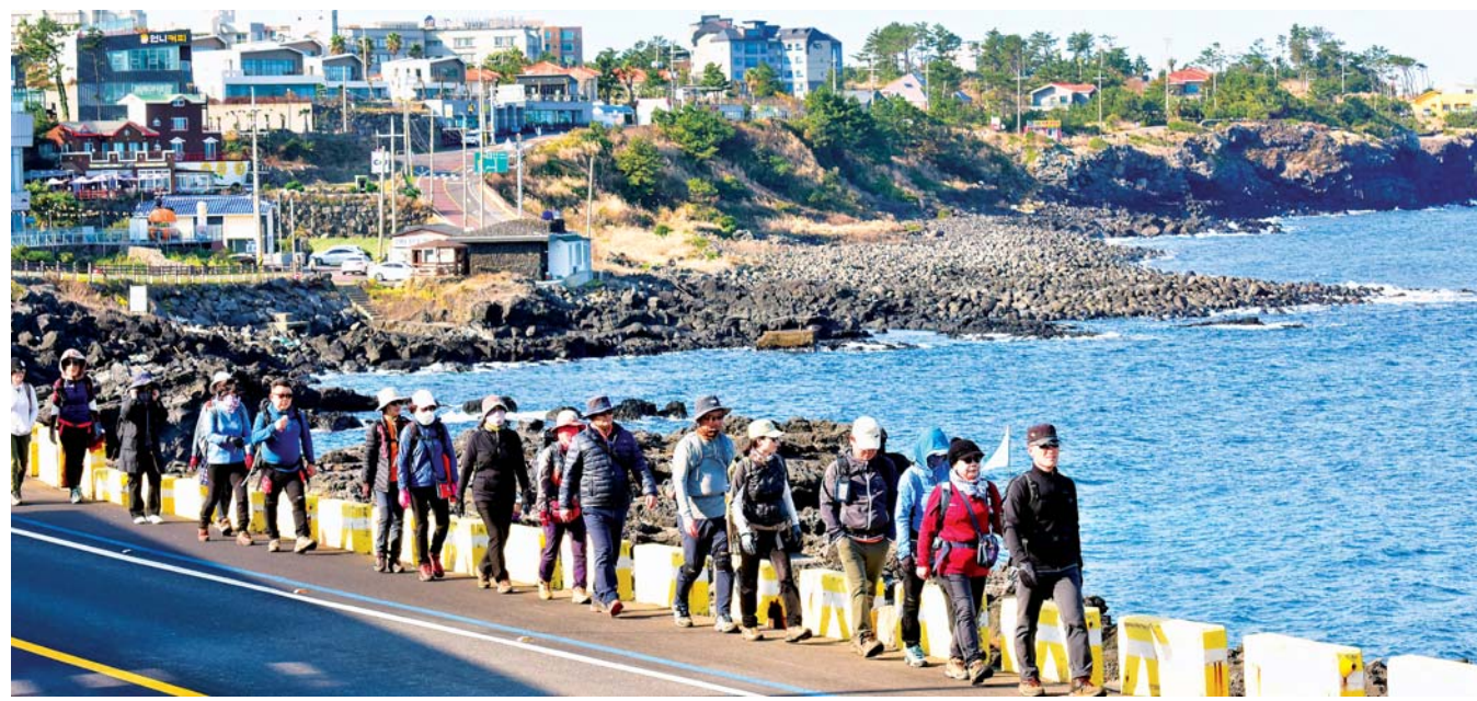
제주 겨울바다 즐기기... 해안도로 트레킹. 겨울잡지 않은 포근한 날씨를 보인 16일 제주를 찾는 관광객들이 제주시 애월읍 해안도로를 걸으며 제주의 겨울바다를 즐기고 있다.