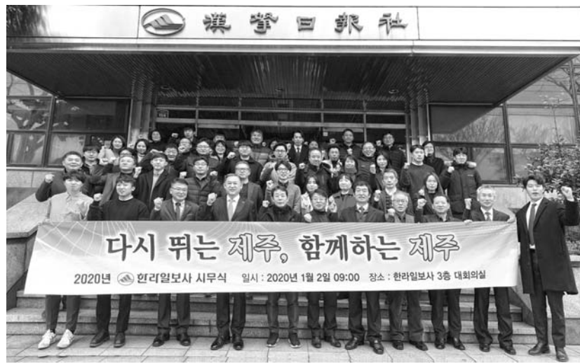
한라일보 임직원들이 2일 사무식을 마친 뒤 회사 정문에서 기념촬영을 하고 있다.

이 대표이사는 “어느 60대 여성이 친구에게 ‘우리 사위는 아침 딸에게 식사를 차려주고, 딸