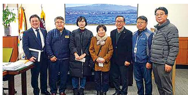
고희범 제주시장은 “제주시 직원들의 마음이 전달돼 하루 빨리 쾌유하기를 바란다”고 말했다.

제주시는 지난 17일 근무중 발생한 질병 등으로 투병중인 직원들에게 제주시청 직원복지회 기금 및 3개 노동조합(전국공무원노동조합, 제주자치도 공무원노동조합, 제주자치도 공무원노동조합) 제주시지부의 모금액을 전달했다.