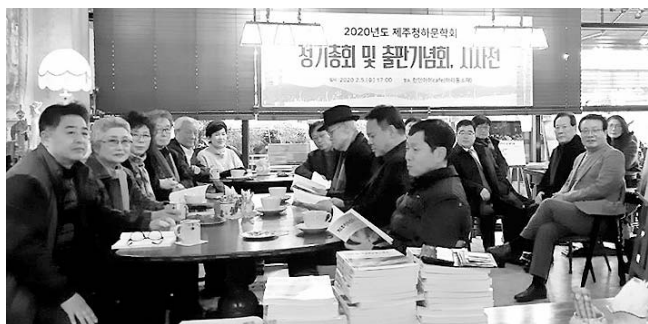
제주청하문학회는 개막일인 5일 제주청하문학회 제번 제 작품집 출판기념회와 정기총회도 열었다.

전시는 이달 15일까지 계속된다. 제주에 이어 이달 18~20일엔 서울로 향해 국회에서 전시를 진행할 예정이다.