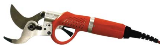
FELCO 820 최대 절단경 45mm