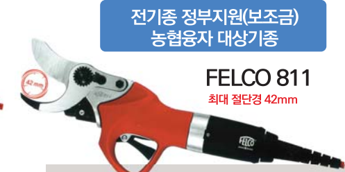
FELCO 811 최대 절단경 42mm