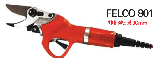
FELCO 801 최대 절단경 30mm