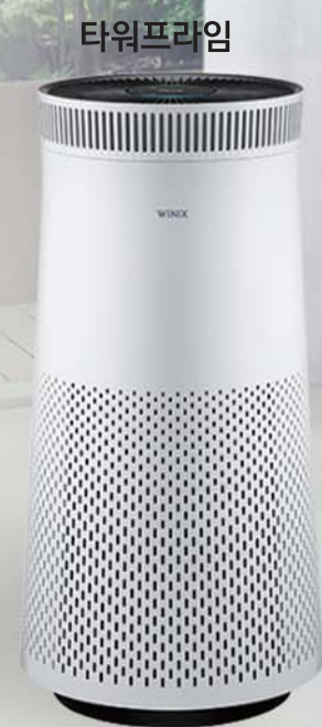
타워프라임 APRM833-JWK (26평) 599,000원 500,000원