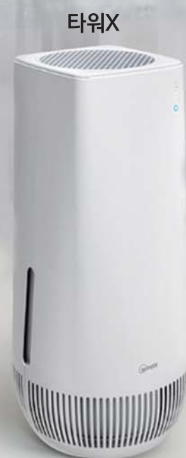
타워X ATGM500-JWK (15평) 329,000원 265,000원