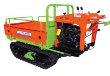
MX-500 (레도형 수동)