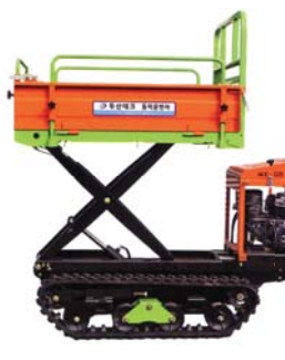
MX-500DL (레도형 덩크+리프트)