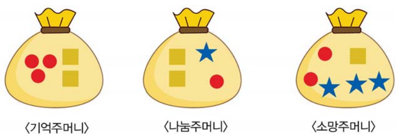
〈기억주머니〉 〈나눔주머니〉 〈소망주머니〉