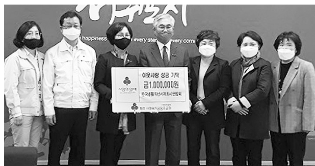
서귀포시 생활개선회 임원들이 서귀포시청을 방문해 코로나19 방지를 위한 후원금을 전달하고 있다.