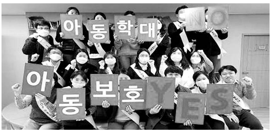
제주가정위탁지원센터의 현판 인증 사진.

손글씨 릴레이 캠페인은 지난 20일부터 5월 4일까지 '아동학대 NO 아동보호 YES'라는 캠페인 문구를 손글씨로 작성하고 사진을 찍은 후 개인 SNS(인스타그램, 페이스북)에 업로드 하고 추가로 대상자 2명을 지