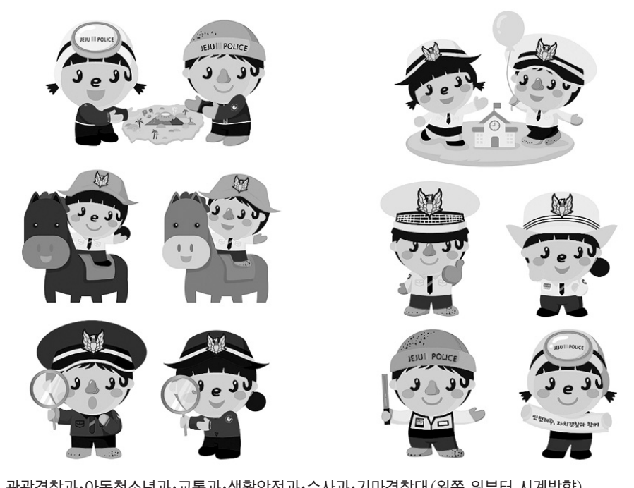
관광경찰과·아동청소년과·교통과·생활안전과·수사과·기마경찰대(왼쪽 위부터 시계방향).

고창경 제주자치경찰단장은 "돌이·솔이 캐릭터를 통해 도민의 경찰인 자치경찰이 도민들에게 좀 더 가깝게 다가갈 수 있는 계기가 되길 바란다"고 밝혔다.