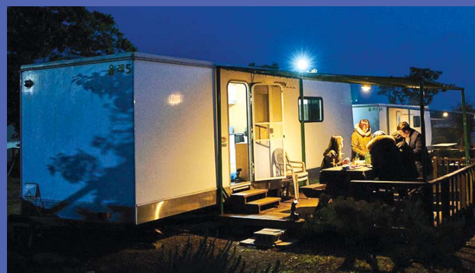
사진 왼쪽부터 시계방향으로 서건도, 물영아리오름, 캠핑