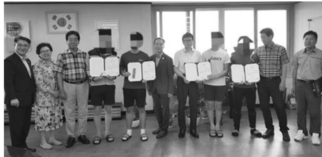
법사량위원회가 380만원 상당의 운동의류와 물품을 학생들에게 선물했다.