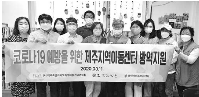
도민들의 삶의 가치를 더하는데 적극 힘을 보탬 수 있도록 청정제주 지킴이 역할을 자처하겠다"고 말했다.