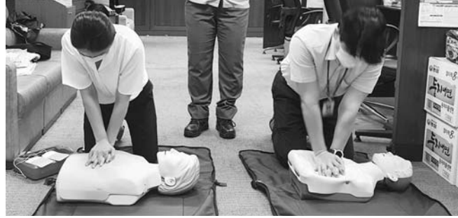
중한 생명을 살릴 수 있는 대응능력을 키우기 위함"이라고 말했다.