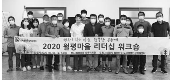
실제 활용 가능한 의사소통 방법을 배우고, 마을 리더들의 역량을 강화하는 방안으로 구성됐다.

이번 워크숍은 '행복이 있는 마을, 행복한 공동체'라는 주제로 ▷마을의 리더십 ▷민주적 회의기법 ▷갈등 해결 과정 ▷갈등 해결을 위한 방법 등 월평마을 내에서