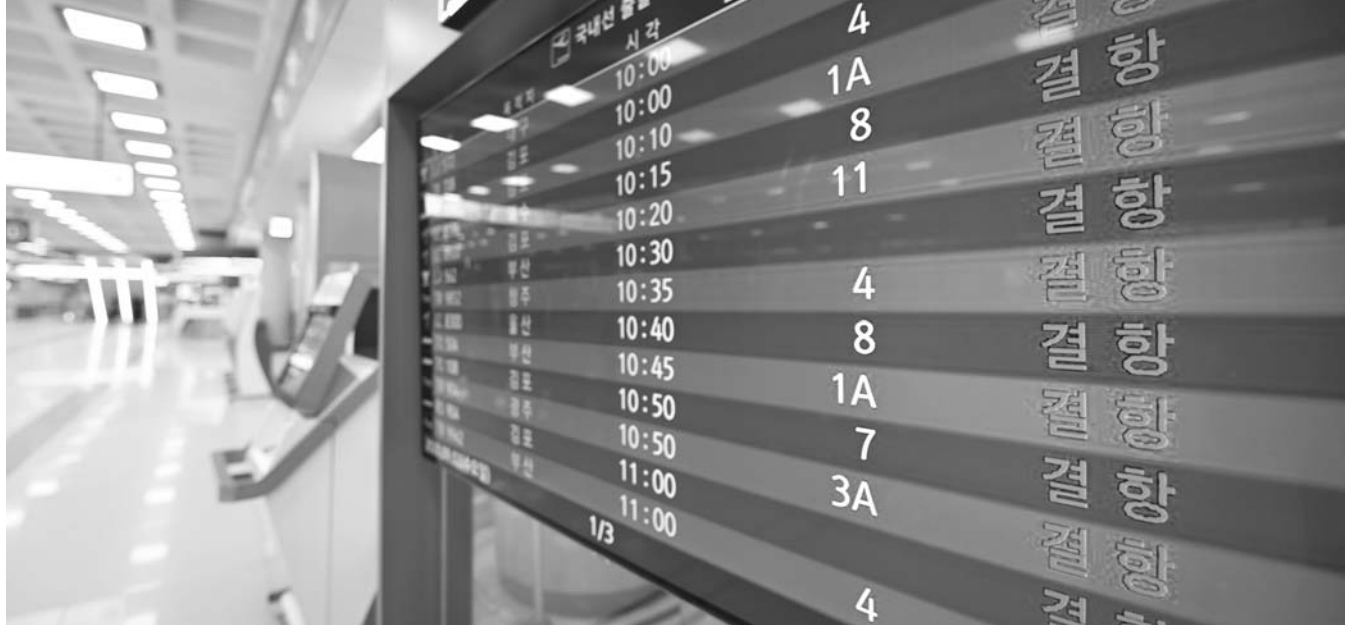
대풍으로 공항 '울스톱' 제9호 태풍 마이삭으로 인해 제주를 오고 가는 항공기들이 모두 결항됐다. 2일 비행기 결항으로 인해 한산한 제주 공항의 모습.