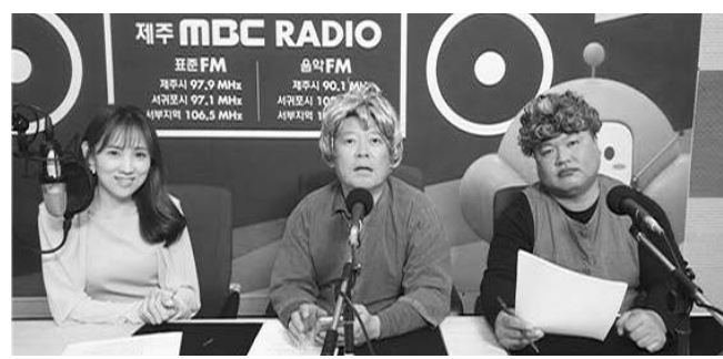
특히 지난해 제주도의 제주어 홍보사업을 위한 제작공모를 통해 제작된 이 프로그램은 일회성 라디오 방송에 그치지 않고 '무자막 버전'과 '자막 버전' 영상을 제작해 도민과 관광객들이 제주어를 쉽게 배울 수 있도록 제주MBC 유튜브 채널에 올려 접근성과 활용도를 높였다.