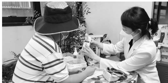
올해 8월까지 340명의 금연 희망자들이 금연클리닉에 등록했고, 87명이 6개월 이상 금연을 유지하고 있다.

제주시 동부보건소는 지역의 금연희망자를 대상으로 '금연클리닉'을 운영, 연중 신청을 받고 있다. 금연 희망자가 첫 등극시 대상자의 혈압과 일산화탄소 측정, 폐기능·니코틴 의존도 검사를 통해 대상으로 확인되면 6개월간 9회에 걸쳐 금연전문상담사의 맞춤형 상담과 각종 행동강화용품, 금연보조제를 제공한다. 코로나19 상황에 대응해 1대1 대면상담과 함께 전화상담도 진행한다. 또 금연 관련 상담 외에도 보건소 사업과 감염병 예방수칙 등도 함께 안내하고 있다.