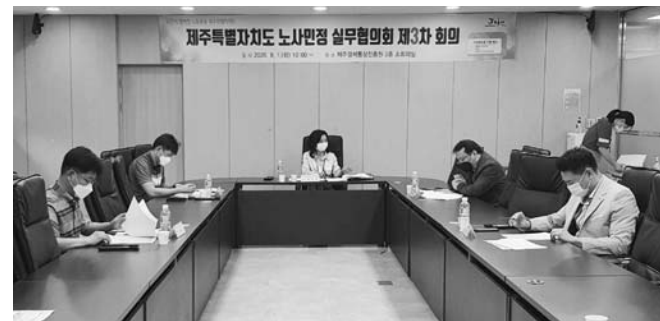
는데 인식을 같이 하고 고용안정을 위한 노사 상생협력 확산과 경제위기 극복 방안, 방역 강화 방안 등을 논의했다.

제주특별자치도 노사민정협의회는 지난 1일 제주경제통상진흥원 2층 소회의실에서 노사민정협의회 실무협의회 위원들이 참석한 가운데 '제주특별자치도 노사민정협의회 제3차 실무협의회'를 개최했다. 이날 실무협의회는 노사 상생과 지역경제 활성화를 위해 ▷2020년 노사 상생 협력 공동선언문 검토 ▷제주특별자치도 노사민정협의회 분과협의회 구성 등 본회의에 상정한 안건 등을 논의했다. 특히 코로나19로 인한 지역경제 위기 극복이 필요하다