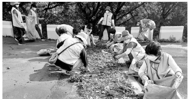
제주시 농협 농가주부모임 회원들이 지난 3일 제주시 오라동 소재 방선문 일대에서 태풍 피해 복구작업을 벌였다.

곳곳에 태풍이 휩쓸고간 흔적이 뚜렷했던 방선문은 구슬땀을 흘리며 봉사한 주부들의 손길로 빠르게 제 모습을 찾아갔다.