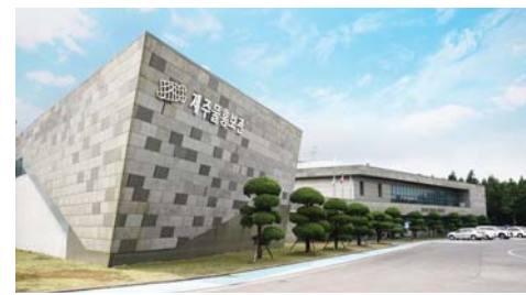
제주도개발공사 물홍보관 전경.

공사는 삼다수 제품 경량화로 시작해 단일재질 무색페트병 사용, 라벨 질취선 표시 도입 등 플라스틱 자원 절감 실천 및 재활용 우수등급 취득과 삼다수 환경성적표지 인증 적용 생산 등 친환경 제품 생산 체계 구축을 위해 지속적으로 노력하고