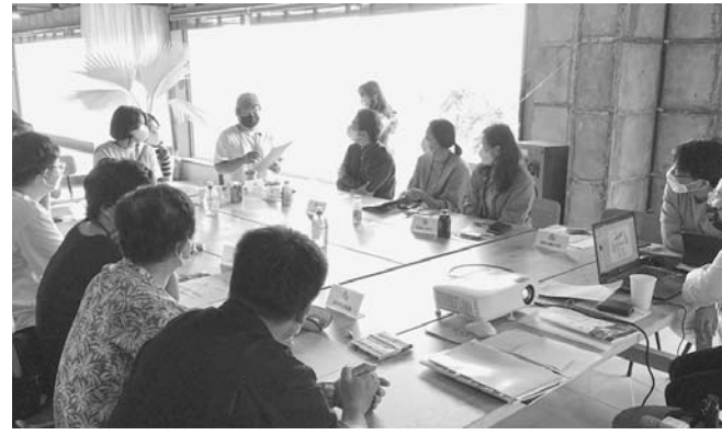
제주바탕합대 등 다양한 주제로 30개 팀이 활동을 준비 중이다.

4쌍의 부부가 오피스텔 책자 발간을 목표로 하는 '금오름 나그네', SNS를 통해 오피스의 아름다움을 세계로 알리는 30대 청년 모임 '오퍼패밀리', 다이빙·수중촬영을 곁에 수중 정화활동을 펼치는 '섬 청소 패거리', 아이들의 주도 아래 청정자연 생태놀이문화를 창조하는 '제주바탕합대' 등 다양한 주제로 30개 팀이 활동을 준비 중이다.