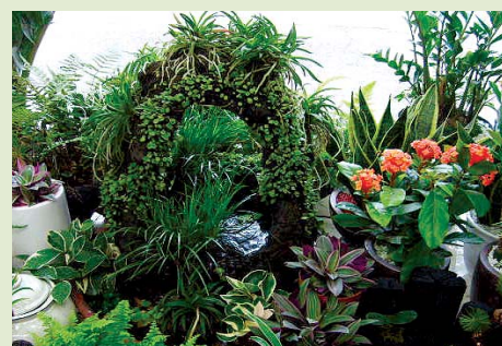
모든정원, 실내조경, 가정, 별장, 빌딩조경, 연못, 인공폭포, 잔디, 조경수 판매

꽃보라화원 ☎ 746-0014, HP 010-3693-5563 (제주시서리 위 국민은행 신제주지점 맞은편 골목) 농장 제주시 용담2동 721번지