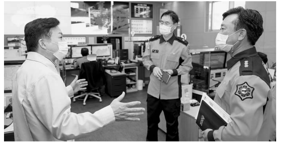
원희룡 제주도지사가 지난 3일 119상황실에서 관계자들과 이야기 나누고 있다.