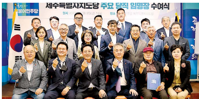
김 바란다"면서 "2022년 대선에서 제주부터 승리할 수 있도록 더욱 노력할 것이며, 지방선거에서 혁신적이고 투명한 공천을 통해 승리할 것을 약속드린다"고 밝혔다.

송 위원장은 "각급 위원회와 특별위원회는 더불어민주당과 제주도민을 위한 정책을 만들어가고, 실천하는 중추적인 역할을 하는 만큼 위원장들께서 잘 이끌어 주