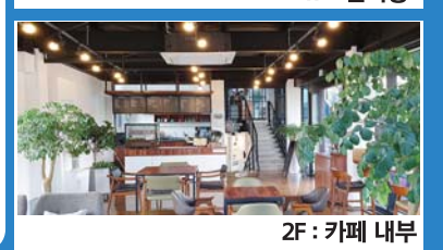
2F: 카페 내부