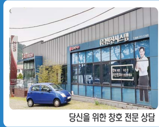
당신을 위한 창호 전문 상담