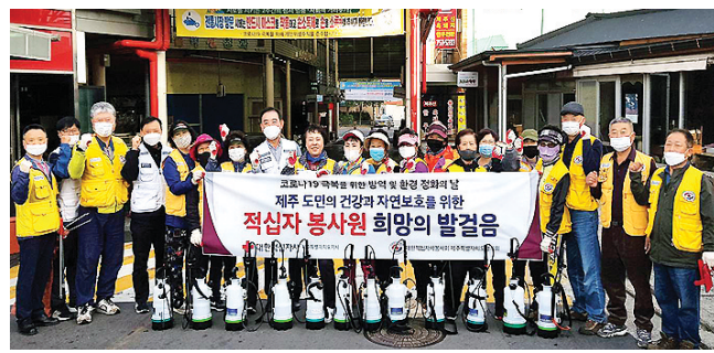
금이나마 도민과 지역사회에 힘을 보태기 위해 봉사활동을 실시했다"며 "앞으로도 도민에게 다가서는 봉사활동을 꾸준히 실시하겠다"고 말했다.