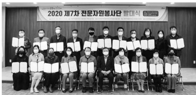
에 전문적이고 체계적인 봉사활동을 전개할 것을 다짐했다.

이날 발대식에 참여한 전문자원봉사단체들은 사례 발표를 통해 다양한 분야에 대한 이해를 높이는 한편 전문자원봉사단으로서 앞으로의 재난·재해 구호 활동