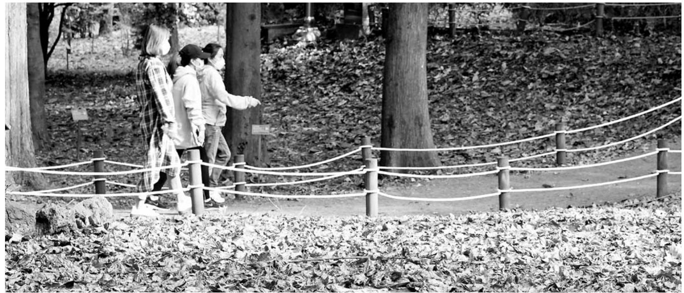
늦기를 속으로 향하는 발걸음 18일 제주시 한라수목원을 찾은 시민들이 떨어진 낙엽들 사이로 산책을 하고 있다.

제주 제2공항, 비자림로 확·포장 공사, 제주동물테마파크 등 5개 개발사업이 제주도의 중점 갈등관리 사업으로 분류됐다. 제주특별자치도는 18일 '2020년 하반기 공공갈등사업 자체 전수조사' 결과를 발표했다. 그 결과 중점 갈등관리 필요 사업에는 제주 제2공항, 비자림로 확·포장 공사, 제주동물테마파크, 오라관광단지, 해상풍력 발전사업 등 5건이 선정됐다.