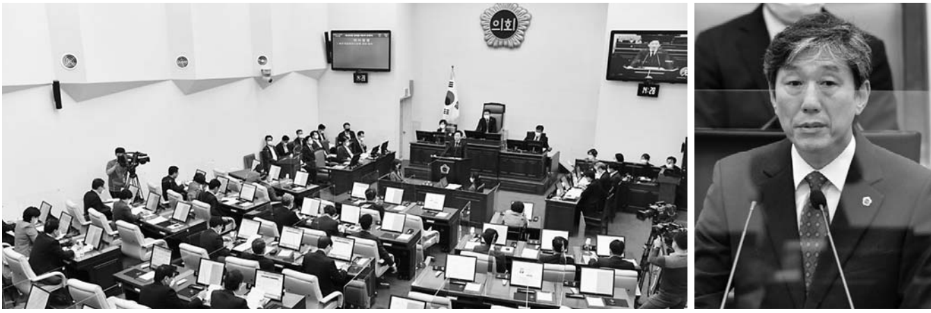
19일 제389회 제주도의회 제2차 정례회 제4차 본회의 도정질문이 진행되고 있다.