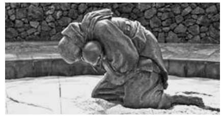
4·3평화공원에 설치된 ‘비설’.

제주특별자치도의회 강철남 의원(더불어민주당, 제주시 연동읍)이 19일 열린 제389회 제2차 정례회 제4차 본회의 도정질문에서 제주 4·3의 공식적인 상징물로 4·3평화공원에 설치된 ‘비설(모녀상)’을 선정할 것을 제안했다. 강 의원은 현재 강요배 화백의 1998년 4·3 50주년 기념 ‘동백꽃 지다’ 순회전에 시작된 동백꽃이 배지, 기념품 등에 활용되면서 현재 대표적인 제주4·3의 상징물이기는 하