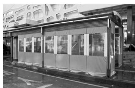
제주버스터미널에 설치된 방한텐트.

제주시는 동절기를 맞아 대중교통 이용객이 많은 개방형 버스승차대에 추위를 피할 수 있는 방한텐트와 발열의자를 설치하고 있다고 22일 밝혔다.