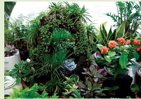
모든정원, 실내조경, 가정, 별장, 빌딩조경, 연못, 인공폭포, 잔디, 조경수 판매

꽃보라화원 ☎ 746-0014, HP 010-3693-5563 (제원사거리 위 국민은행 신제주지점 맞은편 골목) 농장 제주시 용담2동 721번지