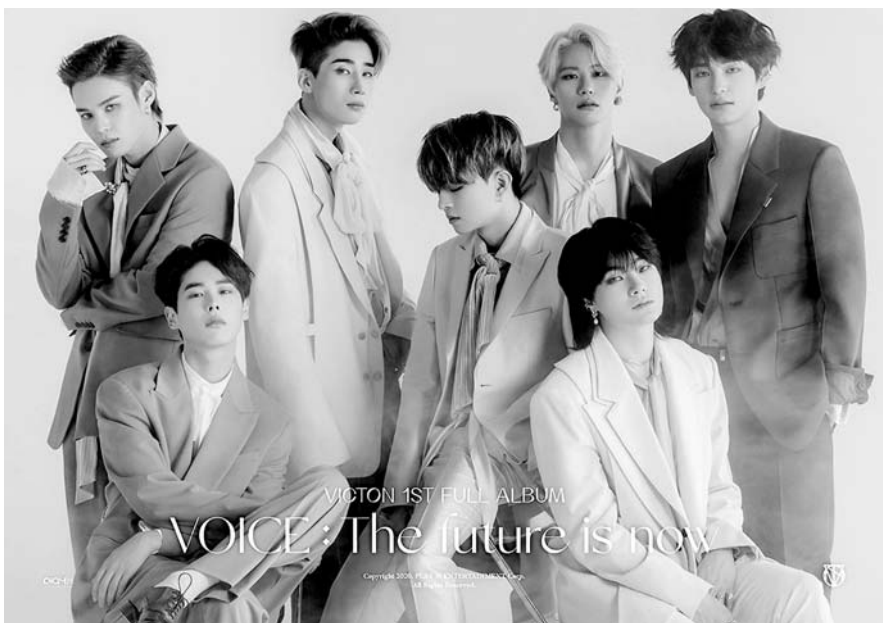
보이그룹 빅톤.

저은 ‘왓 아이세드’(What I Said)로, 라틴풍의 댄스 팝 장르 곡이다. 승우는 “빅톤 ‘제2막의 시작’을 알리는 곡”이라면서 “기존의 그룹 색깔과는 다른 강력하고 독특한 컨셉이고, 특히 퍼포먼스를 강조한 노래”라고 말했다. 승식은 “경쾌하지만 가볍지 않은, 무게감 있는 퍼포먼스와 표정 연기가 관건 포인트가 될 것 같다”고 귀띔했다. 한세 역시 “이번 타이틀곡 안무가 여태 해왔던 퍼포먼스 중 가장 힘들다”며 팬들에게 기대를 부탁했다. 이 밖에도 승우의 자작곡 ‘올 데이’, 승식·수빈이 작사한 팬송 ‘위 스테이’, 한세가 작사·작곡에 참여한 ‘웨어 이즈 러브?’ 등 멤버들이 직접 작업한 곡이 여럿 실렸다. 승식, 허찬, 세준, 한세의 솔로곡인 ‘캐리온’, ‘아이즈 온 유’, ‘유토피아’ 등을 수록하면서 포맷 다양화도 꾀했다. 트랙의 색깔 역시 다채롭다. 타이틀곡은 강력함에 방점을 찍었지만 ‘플