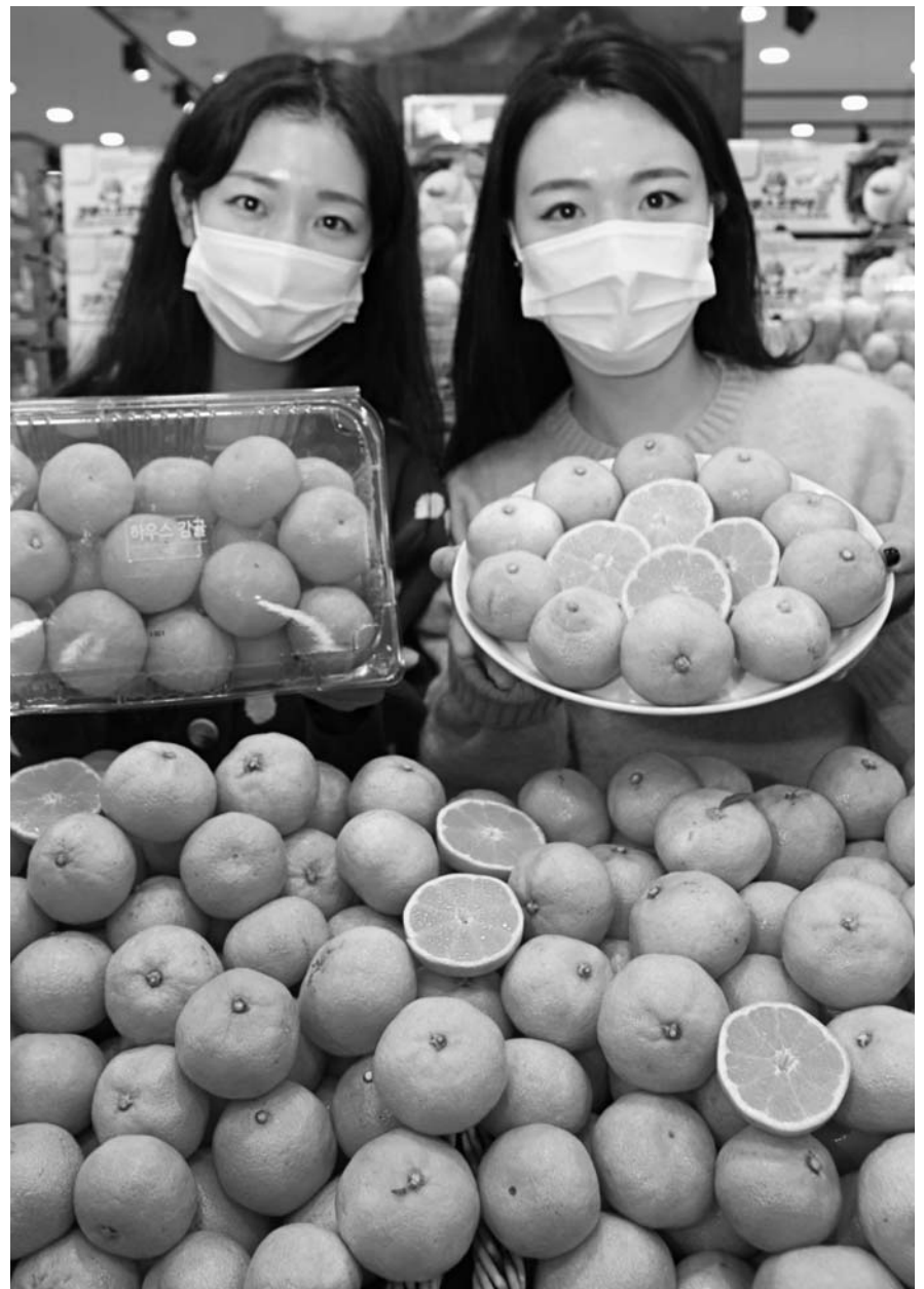
롯데마트, 서귀포 비가림 감귤 판매 14일 서울시 중구 롯데마트 서울역점에서 모델들이 서귀포 '비가림 하우스 감귤'을 선보이고 있다. 비가림 하우스 감귤은 자연 그대로 익힌 자연숙성 감귤로 당도가 높고 감귤에 비해 월동해 높으며 붉은 빛을 띠는 것이 특징이다.

를 산지유통인들이 생산하며, 포전거래 비율은 낮고 포전을 산지 유통인이 임대해 직접 경작하는 임대 경작 비중이 높다. 농협중앙회 제주지역본부 관계자는 “서울 농협하나로마트로 가는 것은 도내 전체생산량의 5% 정도 밖에 안 된다”며 “직거래를 늘리는 방향으로 유통구조를 개선하면 농가들의 수취가격은 높아질 수 있다”고 말했다. 이어 “올해 도내 월동무 생산량은 지난해 32만t보다 증가한 33만t으로 예상되고 있는데 이번 강추위로 인해 월동무가 냉해를 입은 상태라 정확한 생산량은 예측하기가 힘들다”며 “가격안정을 위해 비상품 유통 차단에 노력하고 있다”고 말했다. 고대로기자 bigroad@ihalla.com