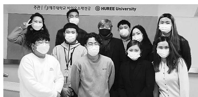
후레대 학생을 대상으로 코로나19 예방에 효과적인 등백꽃을 활용한 손소독제 만들기 행사를 진행했다.