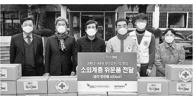
코로나로 인한 사회적 거리 두기에 따라 최소 인원만 참석해 지난 2일 소외계층 위문품 전달식을 가졌다.

기부한 화장품 400세트는 제주적십자사를 통해 대한 적십자 희망복지 연계세대 400가구에 전달될 예정이다.