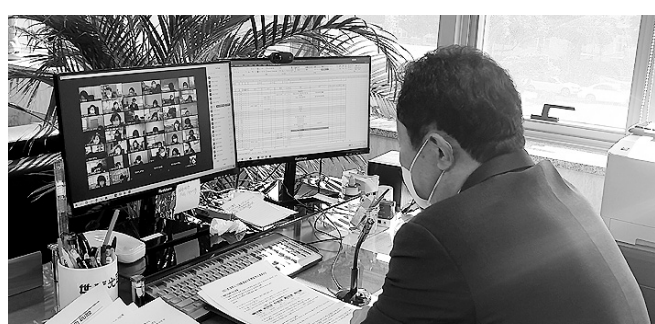
계별 등교수업 밀집도 조치 상황을 공유하는 등 학교장과 소통하고 지원청의 역할을 다하겠다는 의지를 강조했다.

이날 회의에서는 3월 정상 등교를 전제로 ▷입학식 및 개학식 준비 철저 ▷감염병 상황을 고려한 학사일정 수립 ▷기초학력 향상 노력 등 주요 내용을 전달하고 2021학년도 학교교육과정 수립 시 염두에 두어야 할 사항을 중심으로 학교현장의 협조와 주체적인 노력을 당부했다. 또 코로나19 대응 등교수업 확대 운영 방안, 거리두기 단