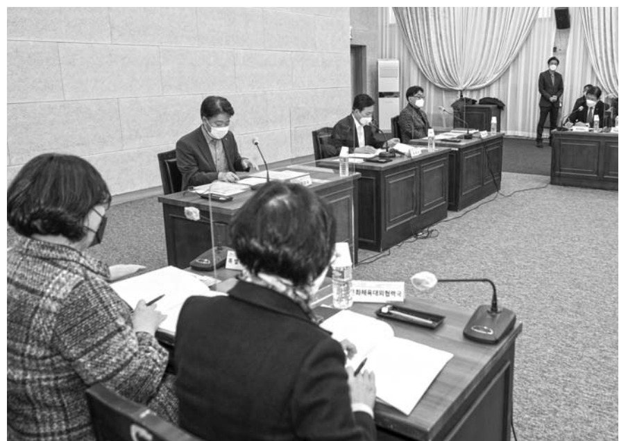
제주특별자치도는 17일 제주도청에서 도내 16개 공공기관이 참석한 가운데 제1차 공공기관 경영전략회의를 열고 각 기관의 경영전략과 재정집행 계획을 점검했다.

12개 출연기관은 제주다움과 제주 가치에 기반한 연구·산업기반 확충 및 지원, 코로나 상황 극복 및 포스트 코로나 시대 대응을 주요 전략으로 내세웠다.