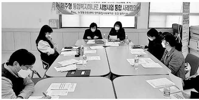
통한 보건·복지 서비스 원스톱 전달 체계를 마련해 주민의 복지제감도 향상에 주력할 계획이다.