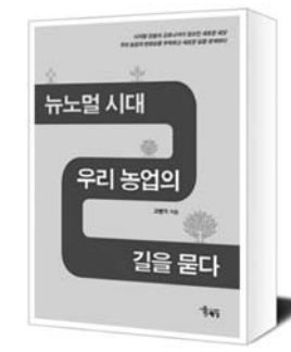
과 맞물려 농가인구 감소, 빈번한 자연재해로 인한 생산 불안정, 밀려오는 수입산과 낮은 식량 자급률, 농가소득 정체 등으로 지속가능한 농업이 불가능해질 것이라며 대안으로 과학, 창조, 회복탄력성, 혁신, 도전, 최고 품질, 생명 중시, 디지털적 사고, 소통과 연대, 메이저리거 정신, 존엄성 등 11가지를 제시했다.