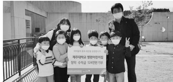
해야 할지 생각하고 나눔에 대해 더 깊이 알아볼 수 있는 기회가 됐다"고 말했다.

이번 후원금은 3세부터 5세반 유아들이 주변의 어려운 이웃을 돕고자 지난달 8일~10일 3일간 사랑나눔바자회를 열어 유아들이 만든 방향제, 마스크 스트랩, 병트리를 판매한 수익금을 기부한 것이다. 신윤숙 원장은 "원아들 스스로 수익금을 어떻게 사용