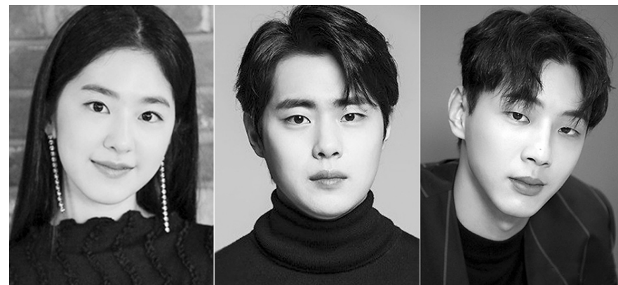
왼쪽부터 배우 박혜수, 조병규, 지수

국내에서도 음악전문채널 엠넷과 티빙이 15일 오전 8시 55분부터 독점 생중계한다.