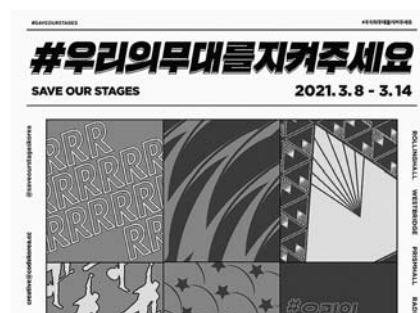
'#우리의무대를지켜주세요' 공연 포스터.

앞서 1차 라인업에는 해리릭버튼, 크라이닛, 노브레인, 가리온 등 12팀이 이름을 올렸으나 여러 가수가 참여 의사를 밝히며 출연진이 크게 늘었다.